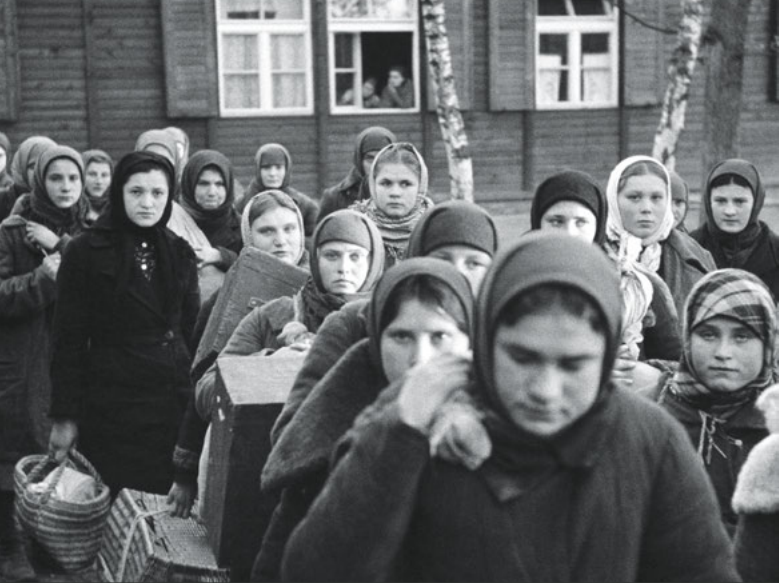
Sowjetische Zwangsarbeiterinnen bei der Ankunft in Berlin, Dezember 1942.