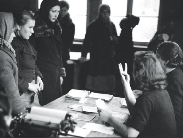
Durchgangslager Berlin-Wilhelmshagen, Dezember 1942. Mitarbeiterinnen des Arbeitsamtes erfassen die Zwangsarbeiterinnen und händigen die Arbeitspapiere aus.