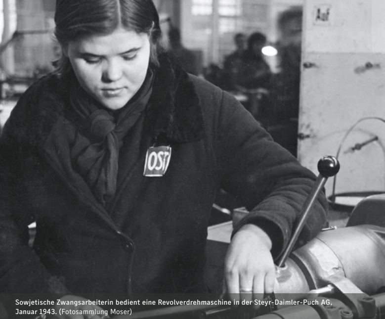
Sowjetische Zwangsarbeiterin bedient eine Revolverdrehmaschine in der Steyr-Daimler-Puch AG, Januar 1943.

Mehr als 20 Millionen Menschen aus fast ganz Europa mussten während des Zweiten Weltkrieges Zwangsarbeit im Deutschen Reich oder den besetzten Ländern leisten. Das nationalsozialistische Regime hatte den Krieg lange geplant und vorbereitet. Sein Ziel war die Unterwerfung und Ausbeutung Europas. Dafür wurden die besetzten Gebiete ausgeplündert und Millionen Männer, Frauen und Kinder nach Deutschland und Österreich verschleppt.