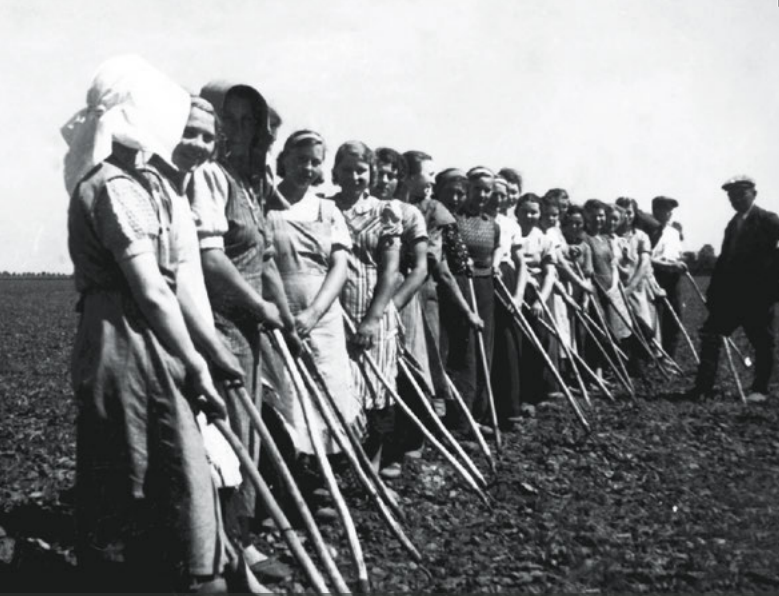
Polnische Zwangsarbeiterinnen in Ostpreußen, undatiert.