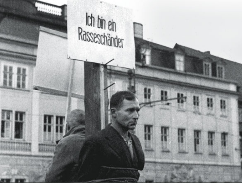
Eisenach, 15. November 1940. Unter dem Vorwurf des „verbotenen Umgangs“ wurden sowohl deutsche Frauen als auch Zwangsarbeiter öffentlich gedemütigt, meist auf Initiative von Parteifunktionären.