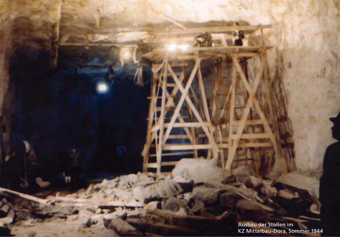
Ausbau der Stollen im KZ Mittelbau-Dora, Sommer 1944