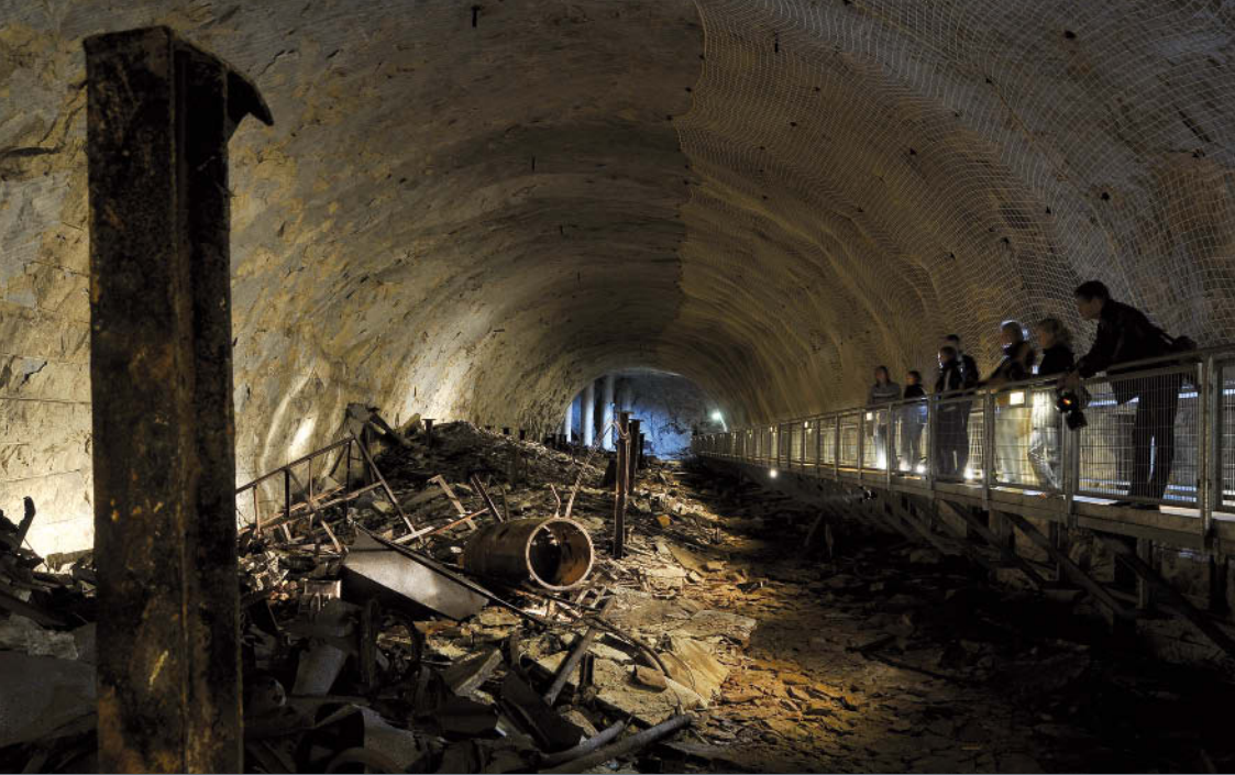
Querstollen im Kohnstein, 1943/44 als Unterkunft für KZ-Zwangsarbeiter genutzt

Zwangsarbeit war von Beginn an ein prägender Bestandteil der KZ-Haft. Zunächst als schikanöses Mittel der Bestrafung und „Erziehung“ eingesetzt, versuchte die SS schon bald, durch gnadenlose Ausbeutung finanzielle Gewinne zu erzielen. In der zweiten Kriegshälfte ging die SS dazu über, Häftlinge als Zwangsarbeiter an die Rüstungsindustrie zu verleihen. Die Häftlinge sollten helfen, die drohende Kriegsniederlage abzuwenden. Zwischen 1942 und 1945 entstanden etwa 1.000 KZ-Außenlager bei Industriebetrieben und Bauprojekten.