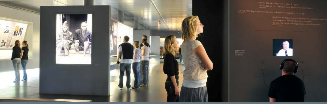
Dauerausstellung der KZ-Gedenkstätte Mittelbau-Dora