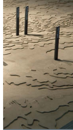
Modell der „KZ-Landschaft“ im Südharz

Die Seminarmodule können auf unterschiedliche Lernvoraussetzungen und Altersstufen zugeschnitten werden.